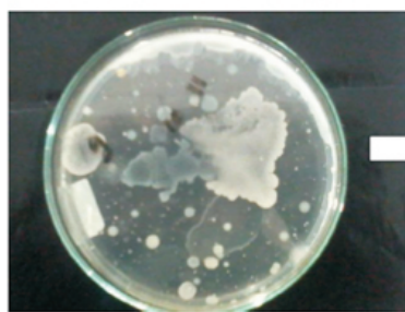
Gambar 1. Hasil Penanaman Limbah

Kultur murni kemudian ditanam pada medium MSM agar, setelah itu diinkubasi selama 3 hari pada suhu 35^\circ\text{C} . Koloni yang tumbuh kemudian dicat dengan Sudan Black. Berdasarkan perulangan pengambilan dan pengkulturan didapatkan 15 sampel yang positif menghasilkan PHB. Isolat positif menghasilkan PHB berwarna biru kehitaman koloninya jika dicat dengan sudan black (Gambar 4). Isolat yang tidak menghasilkan PHB berwarna putih (Gambar 3).