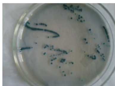
Gambar 4. Isolat yang menghasilkan PHB