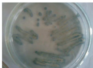
Gambar 3. Isolat tidak menghasilkan PHB