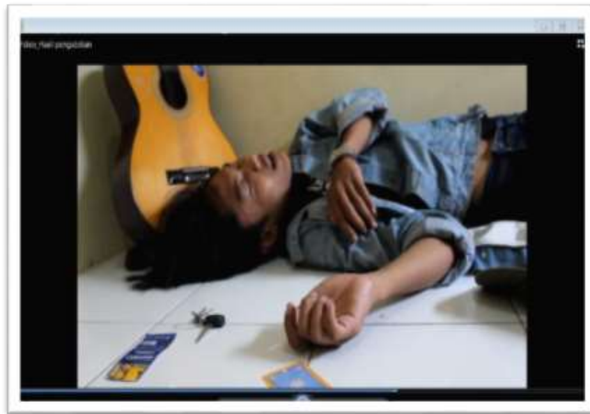
Gambar 2. Hasil editing Video