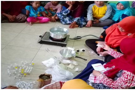
Gambar 1. Pelaksanaan pelatihan pembuatan balsam stik

Formula balsam stik adalah sebagai berikut: