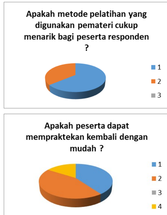
Gambar 3. Hasil kuesioner PPM pelatihan pembuatan balsam

Ketertarikan dan peran aktif dari para peserta terhadap pelatihan pembuatan balsam herbal berbentuk stik ini diharapkan bisa menjadi peluang usaha rumah tangga di lingkungan RW 22 Kalurahan Nusukan, yang merupakan salah satu target luaran dalam kegiatan pengabdian pelatihan pembuatan balsam herbal yang dikemas dalam bentuk stik.