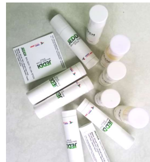
Gambar 2. Produk Balsem stik