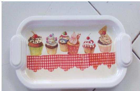
Gambar 6. Contoh produk akhir

Gambar 5 menunjukkan produk yang telah selesai dibuat. Dengan adanya penambahan gambar tersebut membuat produk yang semula terlihat biasa menjadi lebih cantik.