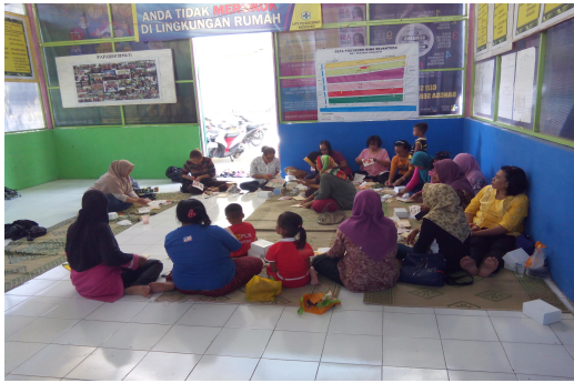
Gambar 2. Tahap pengarahan

2. Tahap kedua adalah menyiapkan bahan materi dasar dan pelengkap serta melakukan pemolesan dasar.