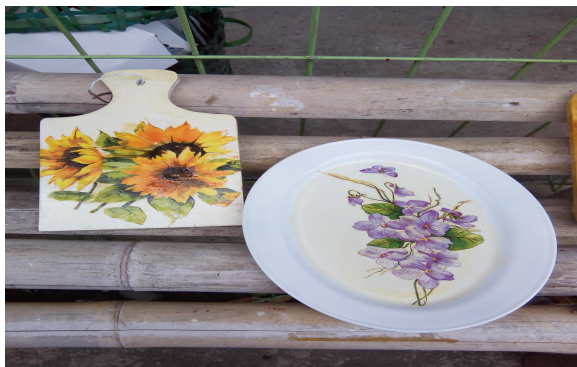
Gambar 9. Contoh produk akhir

Gambar disamping adalah gelas minum berbahan kaca yang telah retak. Dengan kreatifitas peserta yang membuatnya, gelas kaca retak itu berubah menjadi tempat pensil.