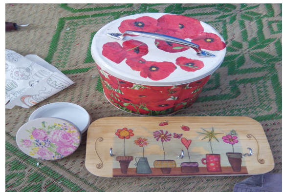
Gambar 7. Contoh produk akhir

Dari baki atau nampan kecil yang sudah lusuh menjadi produk yang bisa dipergunakan lagi atau dijual. Guna mendapatkan nilai yang lebih, diharapkan peserta selalu mengasah kreatifitas dalam membuat produk. Diharapkan dengan adanya kegiatan ini dapat mendorong masyarakat untuk lebih kreatif.