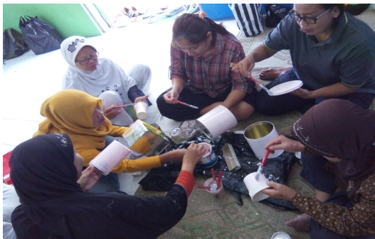
Gambar 3. Tahap persiapan

3. Tahap melukis, jika belum dapat melukis alternatif lain adalah menempel.