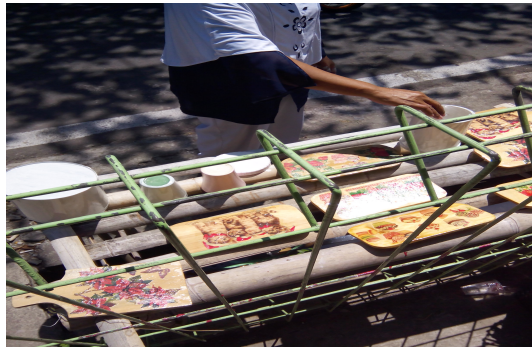
Gambar 5. Tahap pemolesan