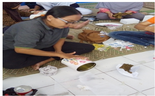
Gambar 4. Tahap menempel

4. Tahap pemolesan dimana dilakukan penghalusan dan penambahan materi lain agar roduk sesuai dengan konsep yang diciptakan. Langkah berikutnya produk di jemur hingga kering.