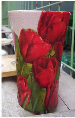
Gambar 8. Contoh produk akhir

Gambar disamping adalah gelas minum berbahan kaca yang telah retak. Dengan kreatifitas peserta yang membuatnya, gelas kaca retak itu berubah menjadi tempat pensil.