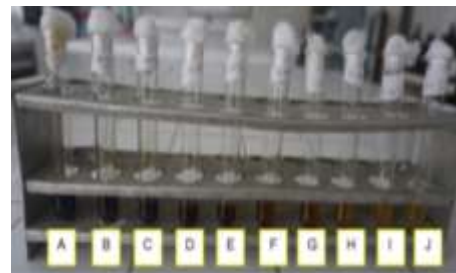
Gambar 3. Uji aktivitas antibakteri dengan metode dilusi

digunakan untuk uji antibakteri dengan metode dilusi untuk nilai KHM) dan KBM) ekstrak daun suruhan terhadap Klebsiella pneumoniae . Nilai KHM tidak dapat diketahui karena warna ekstrak daun suruhan yang gelap yakni hijau tua sehingga kekeruhan yang diakibatkan oleh pertumbuhan bakteri tidak dapat dilihat (Gambar 3). Dzen (2003) salah satu cara yang dapat dilakukan untuk menentukan nilai KHM jika hasil ekstrak terlalu keruh adalah dengan cara difusi cakram atau metode E test . Pertumbuhan bakteri terjadi pada kontrol positif yang berisi biakan bakteri, sedangkan pada kontrol negatif yang berisi ekstrak daun suruhan tidak terjadi pertumbuhan bakteri.