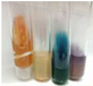
Gambar 2. Hasil uji biokimia dengan media KIA, SIM, Citrat dan LIA