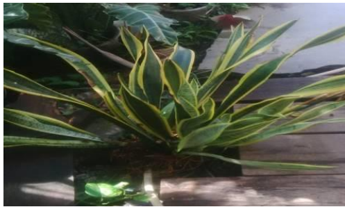
Gambar 2. Daun lidah mertua

Sampel daun lidah mertua ( Sansevieria trifasciata ) diekstraksi dengan menggunakan metode maserasi dengan etanol 70% sebagai pelarutnya. Maserasi merupakan metode penyarian simplisia yang sederhana dan mudah dilakukan. Etanol digunakan karena 70% bersifat semi polar yang mampu melarutkan golongan alkaloid, stereroid, flavonoid, dan saponin [10].