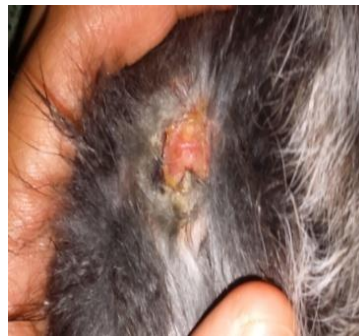
Gambar 4. Hasil uji penyembuhan luka bakar