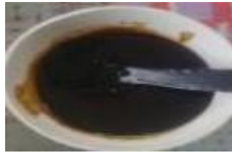
Gambar 3. Ekstrak daun lidah mertua

Ekstrak etanol 70% daun lidah mertua mengandung senyawa saponin, flavonoid, steroid dan triterpenoid yang ditunjukkan dengan hasil positif [11]. Dey [12] juga melakukan analisis GC-MS dengan hasil menunjukkan bahwa daun lidah mertua mengandung senyawa fenolik, alkaloid, terpenoid, flavonoid, steroid, glikosida dan saponin. Hasil ini sesuai dengan peneliti Yoshihiro et al. [13], bahwa Sansevieria mengandung saponin dan steroid. Demikian pula menurut Sastradipraja [14], kandungan lidah mertua antara lain polifenol dan saponin.