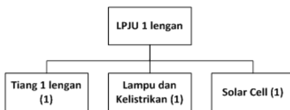
Gambar 1. Kebutuhan Komponen LPJU 1 lengan