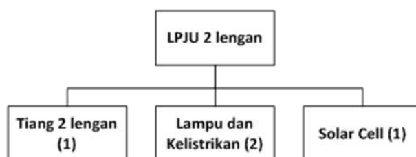
Gambar 2. Kebutuhan Komponen LPJU 2 lengan

Berdasarkan kebutuhan masing-masing komponen seperti Gambar 1 dan 2, selanjutnya dapat dilakukan simulasi jumlah pemesanan dan biaya persediaan pada masing-masing komponen seperti Tabel 3.