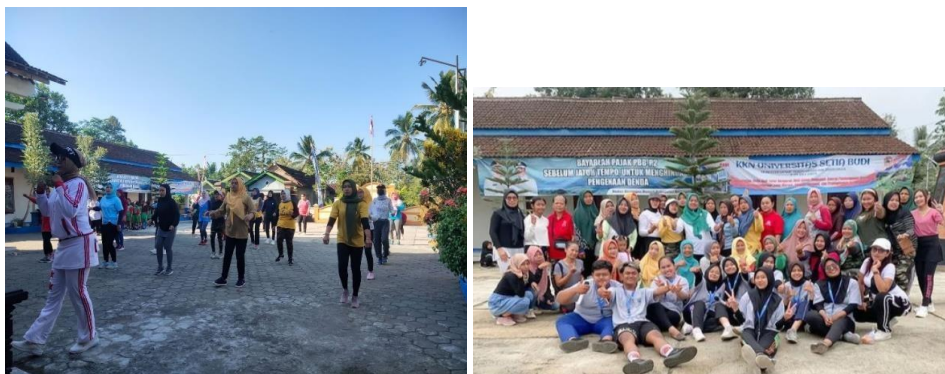
Gambar 4. Kegiatan senam bersama ibu-ibu