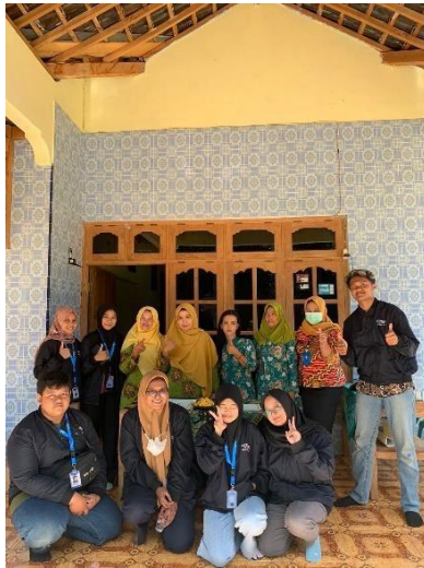
Gambar 2. Kegiatan Posyandu balita dan lansia