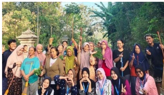
Gambar 3. Kegiatan kerja bakti