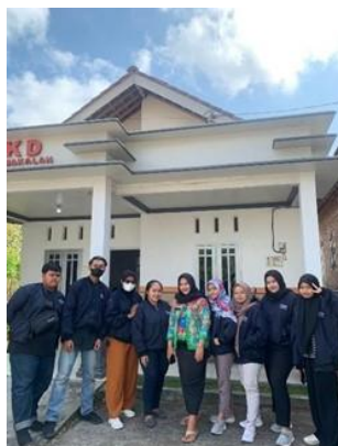
Gambar 1. Diskusi Proker Posyandu